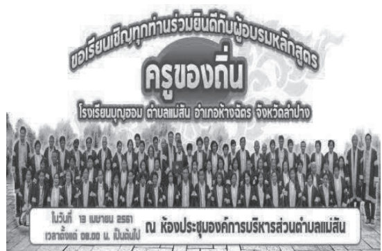
ภาพที่ 4. การรวมพลังสร้างเสริมคุณภาพชีวิตโดยมหาวิทยาลัยราชภัฏลำปาง และองค์การบริหารส่วนตำบลแม่สลับ

จากกระบวนการเรียนรู้เพื่อพัฒนาคุณภาพชีวิตของผู้สูงอายุ ในด้านการเห็นคุณค่าในตน และการสร้างศูนย์การเรียนรู้เพื่อพัฒนาคุณภาพชีวิตของผู้สูงอายุ ขององค์การบริหารส่วนตำบลแม่สลับ สามารถนำเสนอความสัมพันธ์เชื่อมโยง ตามภาพที่ 5 ดังนี้