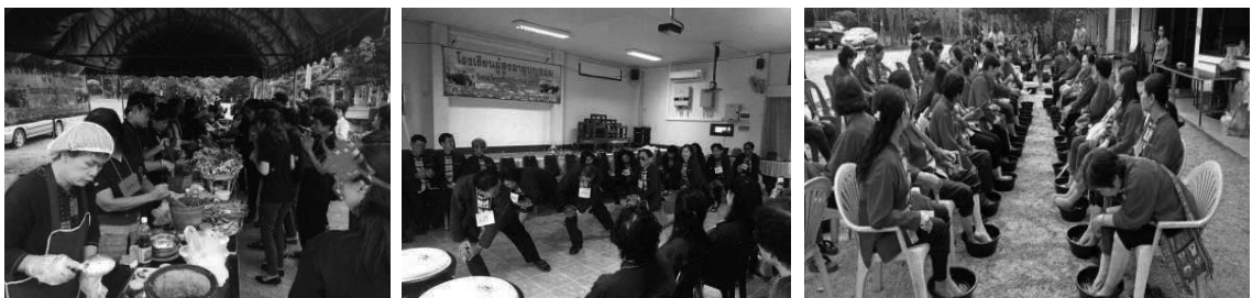
ภาพที่ 2. กิจกรรมการรักษาสุขภาพกายใจในโรงเรียนบุญฮอม

ผลที่เกิดขึ้นในลำดับต่อมาคือ ทำให้โรงเรียนบุญฮอม เกิดกระบวนการเรียนรู้ที่หลากหลายผ่านประสบการณ์ของผู้สูงอายุเหล่านี้ อีกทั้งโรงเรียนบุญฮอมเตรียมความพร้อมการรองรับผู้สูงอายุ คือเปิดโอกาสรับทุกคน ทุกเพศ ทุกวัย เข้าศึกษาได้ทั้งหมด ไม่จำกัดว่าต้องเป็นผู้ที่มีอายุ 60 ปีขึ้นไปเท่านั้น เพราะแนวคิดที่ว่า “ทุกคนต้องมีโอกาสได้เป็นผู้สูงอายุ” จนกระทั่งปัจจุบันโรงเรียนบุญฮอมได้ยกระดับเป็นครอบครัวบุญฮอม