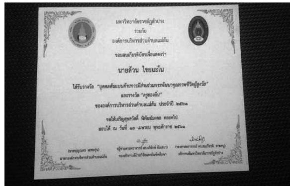
ภาพที่ 3. การเป็นตัวแทนของโรงเรียนบุญฮอมเข้าร่วมกิจกรรมของจังหวัด และเกียรติบัตรการเชิดชูครูของถิ่น