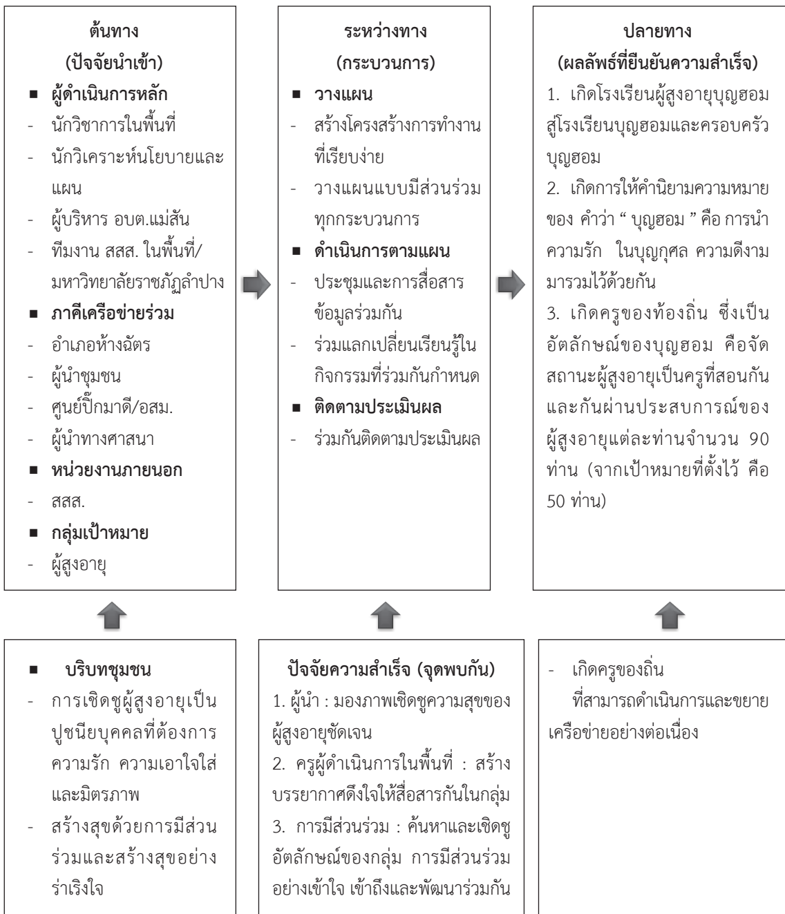
ภาพที่ 5. กระบวนการพัฒนาคุณภาพชีวิตผู้สูงอายุ ขององค์การบริหารส่วนตำบลแม่สัน อำเภอห้างฉัตร จังหวัดลำปาง