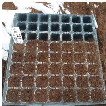
รูปหลังจากทำการกลบเมล็ดแล้ว