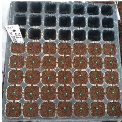
รูปซ้าย : วางเมล็ดก่อนการกดลงในพีทมอส